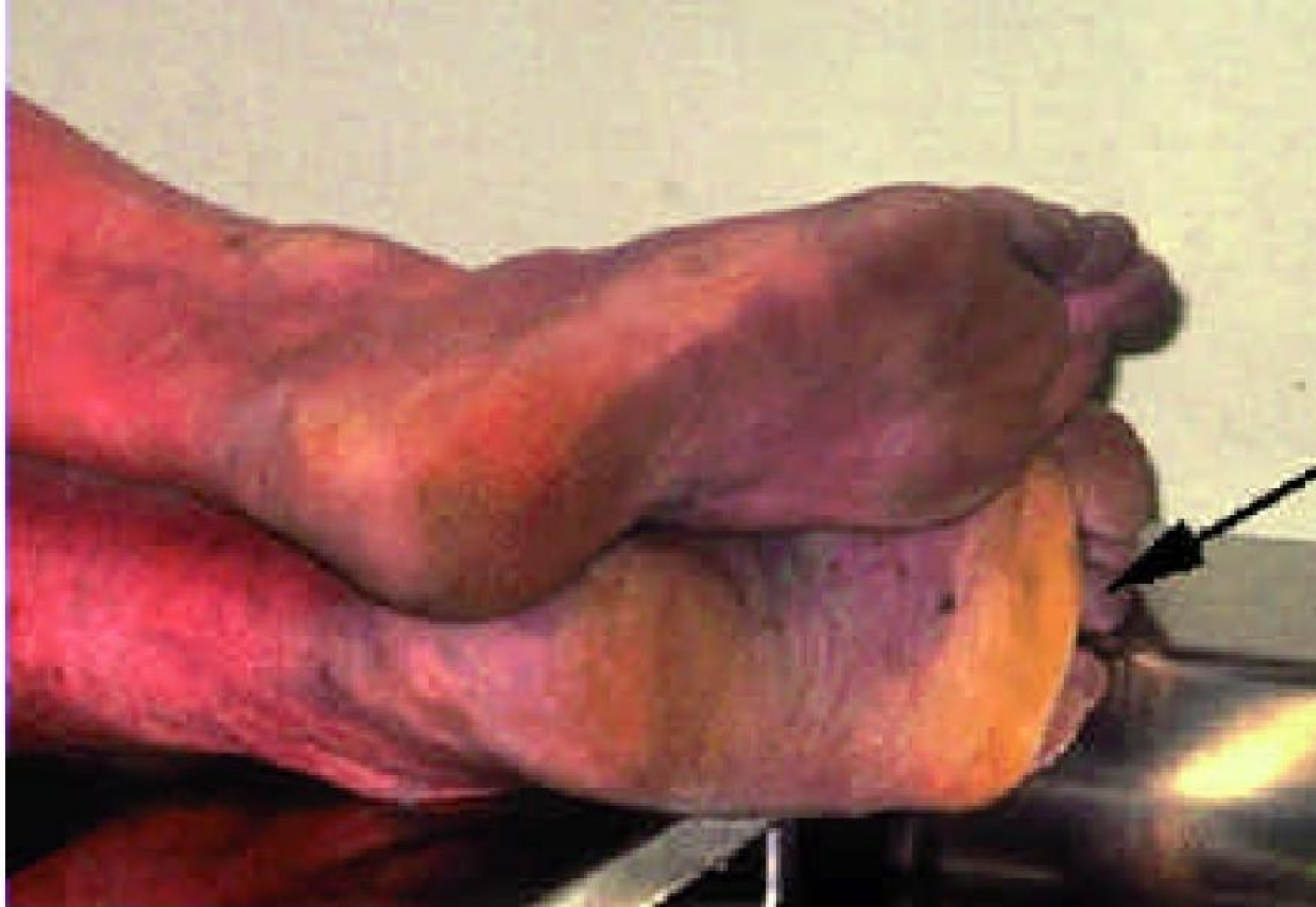
FIGURE 9.10 The bottom of the feet also reveal which foot was resting on the chair and which was in contact with the floor. The bottom of the left foot (top) is in contact with the floor.