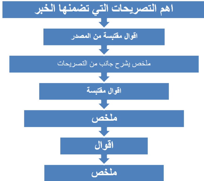
شكل يوضح قالب الهرم المقلوب المتدرج

وهو هرم مقلوب ولكن متدرج، حيث يقوم هذا القالب على اساس الهرم المقلوب ولكن يأخذ شكل المستطيلات المتدرجة ، بحيث يكون للخبر مقدمة تتضمن اهم تصريح في الخبر ثم يأتي بعدها جسم الخبر في شكل فقرات متعددة يشرح ويخلص كل منها جانباً من جوانب الخبر، وبين كل فقرة واخرى يذكر نص تصريح لمصدر الخبر او الشخصية التي يدور حولها الخبر ليؤكد ماسبق وشرحته الفقرة السابقة وهكذا على ان ترتب كل فقرة ومايينها من فقرات مقتبسة من اقوال المصدر حسب اهمية كل منها وفقاً لقاعدة الـ اهم – فالاهم ، وهذا مايعني ان الهرم المقلوب المتدرج هو اصلح القوالب الفنية في كتابة الاخبار القائمة على سرد التصريحات كما هو الحال في المؤتمرات الصحفية او البيانات السياسية والندوات .