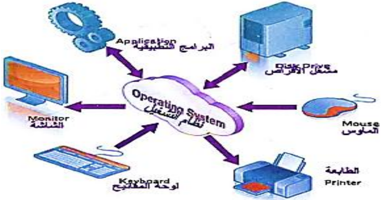
الشكل (1-4) وظائف نظام تشغيل مع المكونات المادية لجهاز الحاسوب