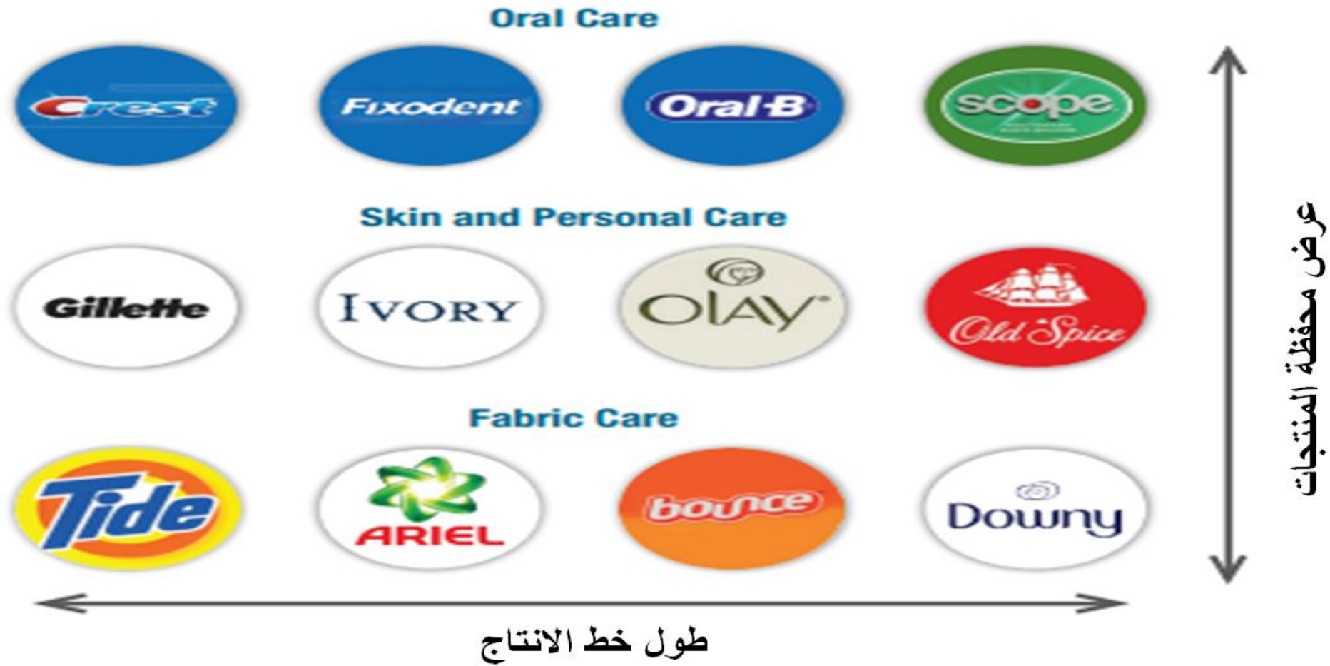
الشكل 8.1: عرض محفظة المنتج وطول خط الإنتاج لمنتجات Procter & Gamble