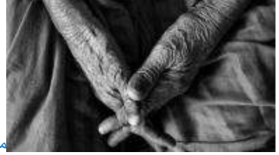
ما هو سن الشيخوخة