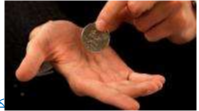
كيف تقوم بخدع سحرية