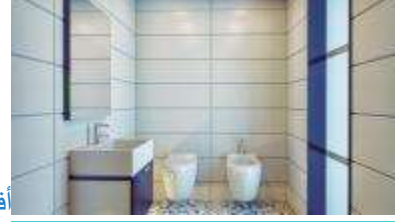
أفكار لتزيين الحمام