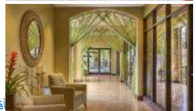
أفكار لمدخل البيت