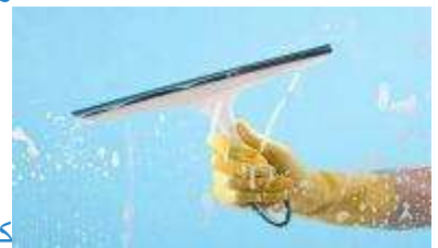
كيف أنظف زجاج المرايا