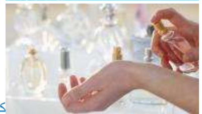
كيف تصنع عطراً طبيعياً