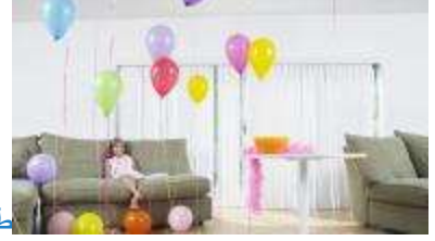
طريقة تزيين البيت