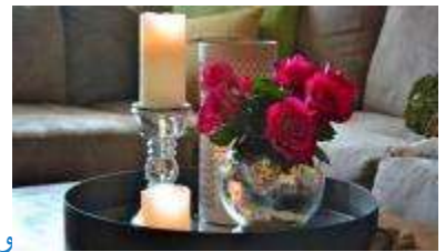
وسائل تجميل المنزل