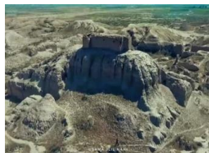
المنارة الاثرية في عفك (نيبور)

ويمكننا القول بأن هذه اللعبة بدأت في بلاد وادي الرافدين لوجود حقيقة تاريخية تؤكدتها اللوحة الأثرية التي تم اكتشافها عام (١٩٧٧م) في مدينة عفك (عفك) في جنوب محافظة (الديوانية) حيث تعد مدينة عفك أو نيبور او (نفر)، العاصمة الدينية لل سومريين والبابليين لكونها تضم مقر الاله أنليل وزوجته نينليل.