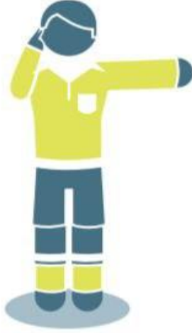
التحقق: الأصبع إلى الأذن مع مد اليد/ الذراع