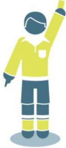
بطاقة صفراء أو حمراء