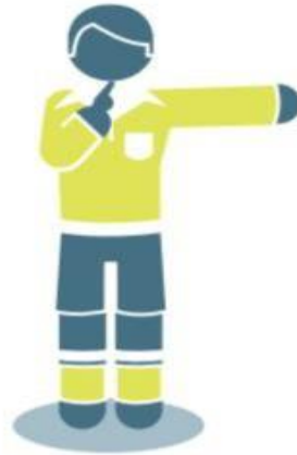
ركلة حرة مباشرة