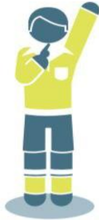
ركلة حرة غير مباشرة