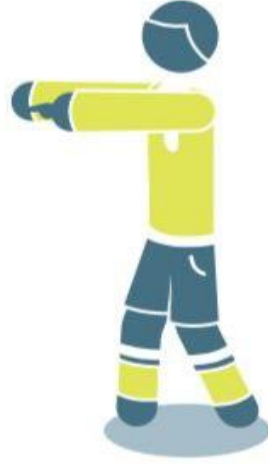
إتاحة فرصة (١)