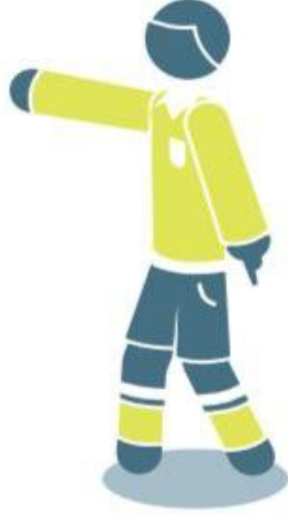
إتاحة فرصة (٢)