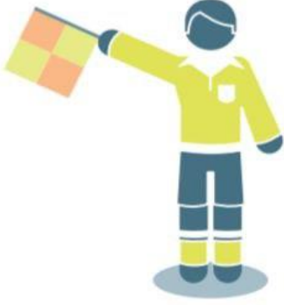
رمية تماس للفريق المهاجم