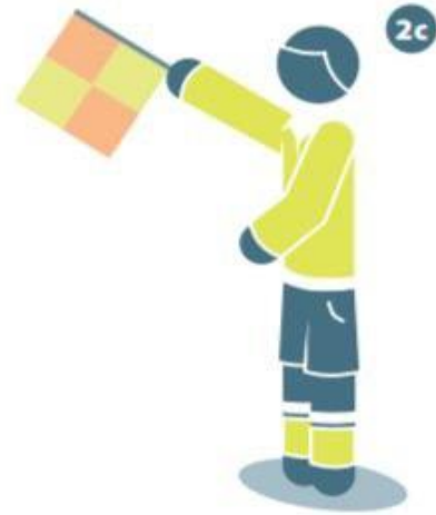
تسلل في وسط ميدان اللعب