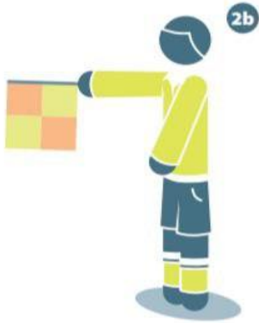
تسلل في الجهة البعيدة من ميدان اللعب