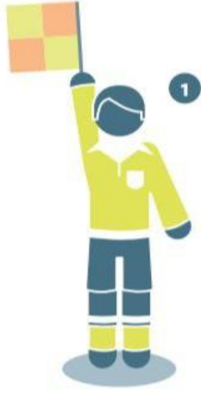
تسلل في الجهة القريبة من ميدان اللعب