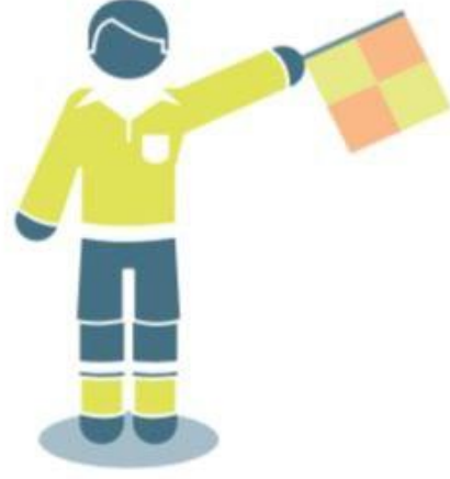
رمية تماس للفريق المدافع