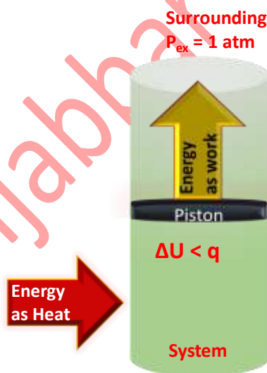
Figure 2-6: A system is subjected to constant pressure and is free to change its volume.

أما عند انتقال الطاقة على شكل حرارة ويحصل هنالك تغير في حجم النظام سواء أكانت عملية تمدد أو تقلص في النظام، فإن العملية في هذه الحالة ستتم تحت ضغط ثابت وإن الطاقة الداخلية للنظام سوف لن تساوي الطاقة المنتقلة كحرارة. تحت هذه الظروف فإن بعض من هذه الطاقة المنتقلة إلى النظام على شكل حرارة سوف تعود إلى المحيط على شكل شغل تمدد كما في الشكل (2-6) وإن الطاقة الداخلية للنظام سوف تكون أقل من الحرارة المنتقلة ( \Delta U < q ). في هذه الحالة فإن الطاقة المنتقلة إلى النظام على شكل حرارة تحت ضغط ثابت تكون مساوية إلى التغير في خاصية ثرموديناميكية أخرى للنظام يطلق عليها المحتوى الحراري (Enthalpy).