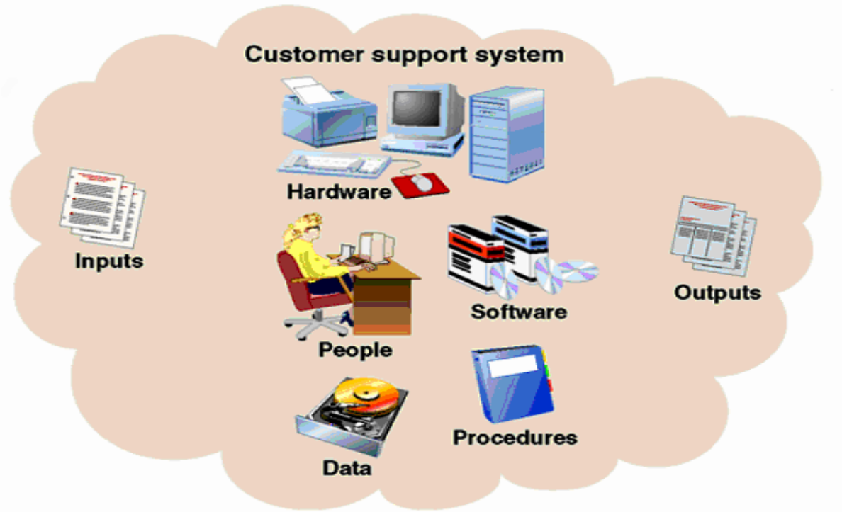
Figure 1. 1 Components of Information System