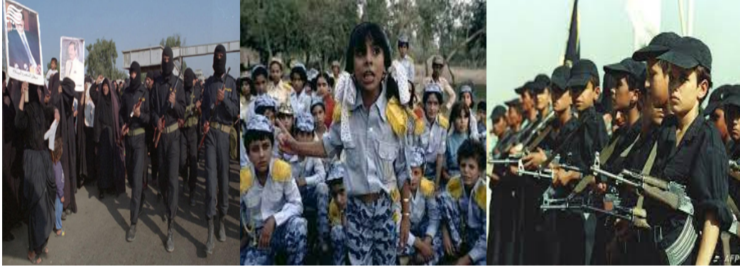
صورة (٢-٤) تبين تشكيلات (أشبال صدام، الطلائع، فدائيي صدام)

لقد أسهمت هذه السياسة في تحويل المجتمع إلى معسكر كبير للتدريب على حمل السلاح وتفعيل استعماله فيما جر الولايات على الشعب العراقي وشعوب المنطقة بما تحصل في حربي الخليج الأولى، والثانية، وحرب تغيير نظام البعث. وقد سلبت سياسات النظام - المتعلقة بعسكرة المجتمع - من ذلك المجتمع حقه في العيش الآمن المستقر والاستمتاع بحياة صحية آمنة وطويلة؛ ففي الوقت الذي كانت فيه شعوب المنطقة تعيش التنمية على المستويات كافة كان العراق غارقاً في دوامات الحرب والدمار.