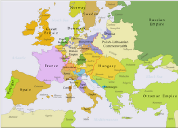
أوروبا في السنوات التي تلت معاهدة إكس لا شابيل عام 1748

معاهدة إكس لا شابيل الموقعة في 18 من أكتوبر 1748م (أو معاهدة آخن )، والتي أنهت حرب الخلافة النمساوية عقب اجتماع المؤتمر في 24 من إبريل لعام 1748م في مدينة آخن بالإمبراطورية الحرة، المسماة إكس لا شابيل (بالفرنسية: Aix-la-Chapelle)، الواقعة غرب الإمبراطورية الرومانية المقدسة.