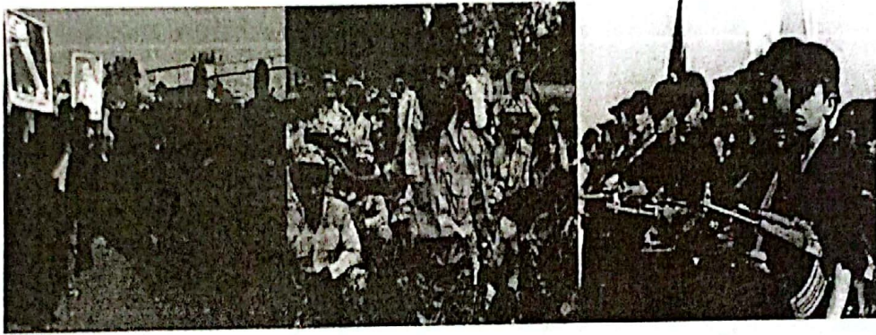
صورة (٢ - ٤) تبين تشكيلات (أشبال صدام، الطلائع، فدائيي صدام،)

لقد أسهمت هذه السياسة في تحويل المجتمع إلى معسكر كبير للتدريب على حمل السلاح وتفعيل استعماله فيما جر الولايات على الشعب العراقي وشعوب المنطقة بما تحصل في حربي الخليج الاولى، والثانية، وحرب تغيير نظام البعث. وقد سلبت سياسات النظام - المتعلقة بعسكرة المجتمع - من ذلك المجتمع حقه في العيش الأمن المستقر والاستمتاع بحياة صحية آمنة وطويلة؛ ففي الوقت الذي كانت فيه شعوب المنطقة تعيش التنمية على المستويات كافة كان العراق غارقاً في دوامات الحرب والدمار.